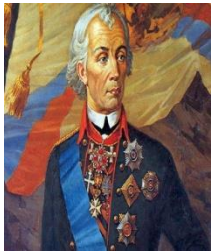
А) А.В. Суворов