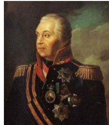
Б) М.И. Кутузов