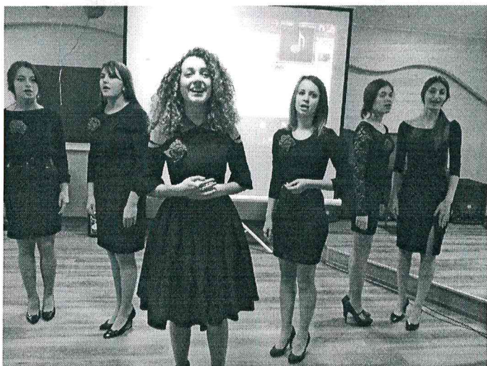
Ансамбль «Импульс» - дипломант городского фестиваля «Автомат и гитара».