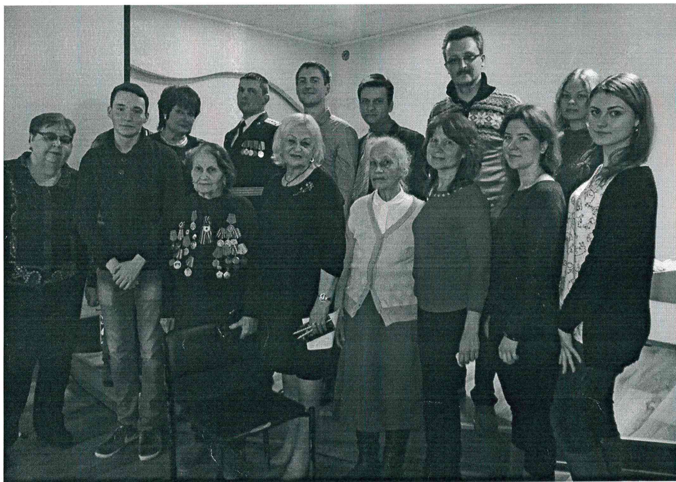
Встреча поколений в канун Дня защитника Отечества.